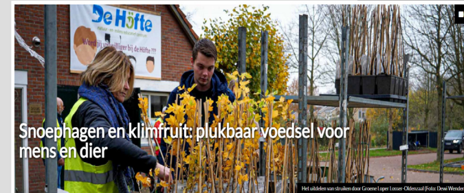
Snoephagen en klimfruit: plukbaar voedsel voor mens en dier

De persberichten zijn goed opgepakt door de pers en er is in meer dan 13 nieuwspagina's aandacht aan geschonken. Diverse acties werden onder de aandacht gebracht, vooral de eetbare struiken acties deden het goed. Hier een impressie van de berichten die zijn geplaatst: Rechtstreekse mailing naar het netwerk, Social media, Persberichten, onder andere in Huis aan Huis bladen, Groen Bezig RTV Vechtdal/Stentor/Peperbus/NOS Regio Innocent Groene Vrienden actie wn Website van diverse gemeentes .